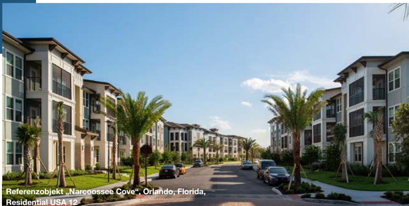
Referenzobjekt „Narcoossee Cove“, Orlando, Florida, Residential USA 12

Attraktive steuerliche Rahmenbedingungen