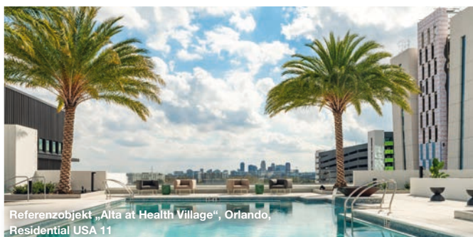
Referenzobjekt „Alta at Health Village“, Orlando, Residential USA 11