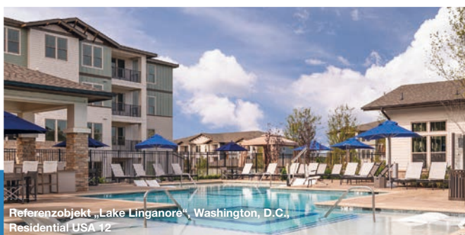
Referenzobjekt „Lake Linganore“, Washington, D.C., Residential USA 12

Im Fokus der BVT Residential USA Serie stehen Investitionen in die Entwicklung und die anschließende Veräußerung von „Class-A“-Apartmentanlagen an sorgfältig ausgewählten Standorten mit guten Wirtschaftsprognosen im sogenannten „Sunbelt“, also dem Südosten, bzw. an der Ostküste der USA. Hierzu gehören z.B. die Metropolregionen Boston, Washington, D.C., Orlando oder Atlanta. Mit 48 Jahren US-Immobilienenerfahrung, eigenen Büros in den USA und einem hauseigenen US-Steuerservice ist BVT ein starker und zuverlässiger Investitionspartner. Bisher wurden 19 Beteiligungsgesellschaften mit einem Investitionsvolumen von insgesamt über 2,2 Mrd. US-Dollar aufgelegt, die zusammen 33 Apartmentanlagen mit insgesamt über 10.000 Wohnungen entwickelt haben bzw. entwickeln. Elf Beteiligungsgesellschaften wurden bereits veräußert.