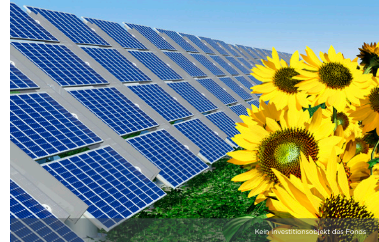
Kein Investitionsobjekt des Fonds

Prognostizierte Gesamtausschüttung von 173% , bei einer Laufzeit von 10 Jahren