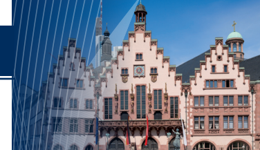
25.09. Frankfurt am Main